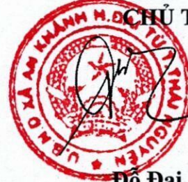
Đỗ Đại Phong